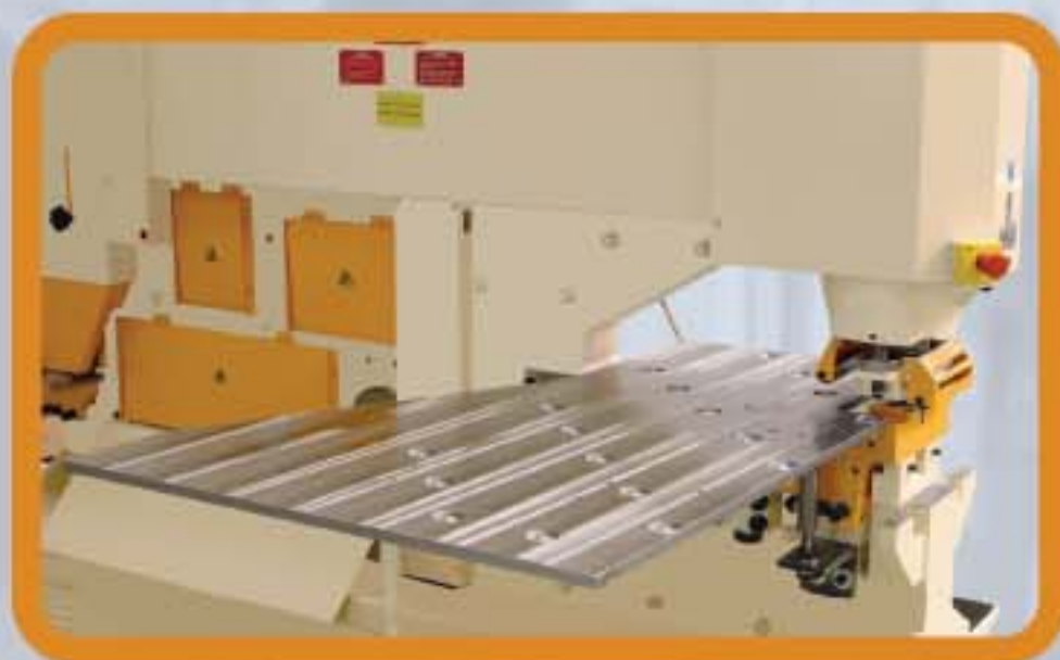
Stół z kulkami ślizgowymi (zob. zdjęcie). Stoły mogą zostać wyposażone w kulki ślizgowe, rozmieszczone na powierzchni 2, 3, 4 i 5 metrów.