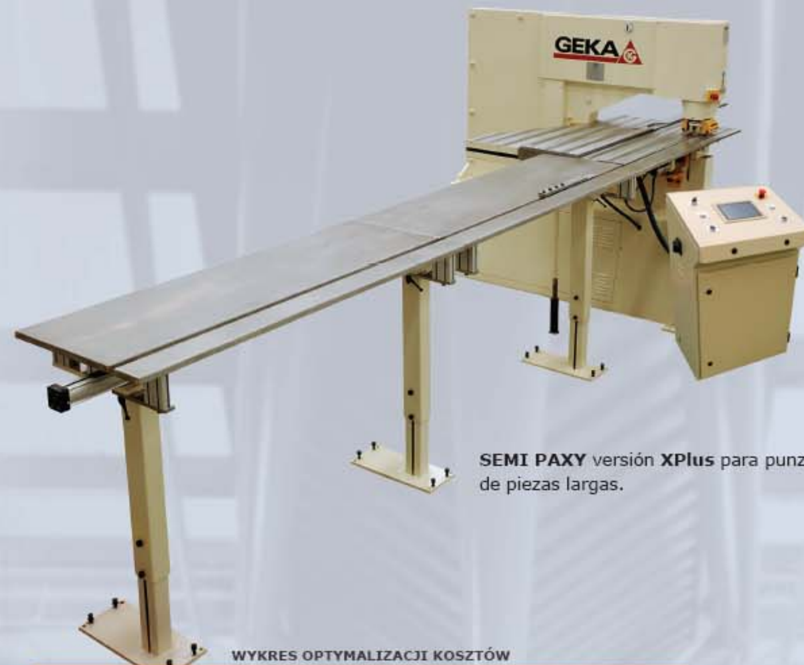
SEMI PAXY versión XPlus para punzonado de piezas largas.