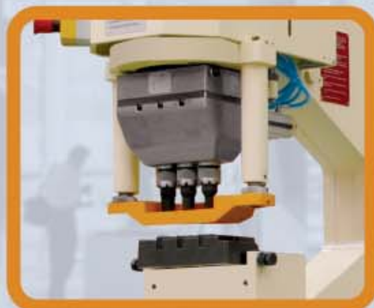
Jeśli elementy mają więcej niż jedną średnicę do wykrawania, zalecane jest zastosowanie potrójnego mocowania stempli i matryc.