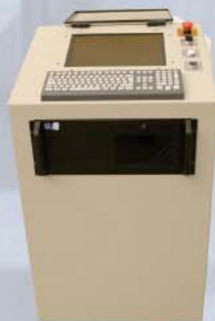
Komputer (jednostka kontrolna) z ekranem dotykowym i możliwością importowania plików DXF i DSTV, szkicowania na ekranie i automatycznego tworzenia programów.